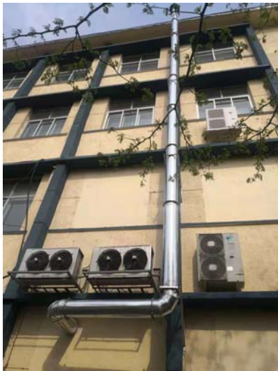
照片 9 排风管道