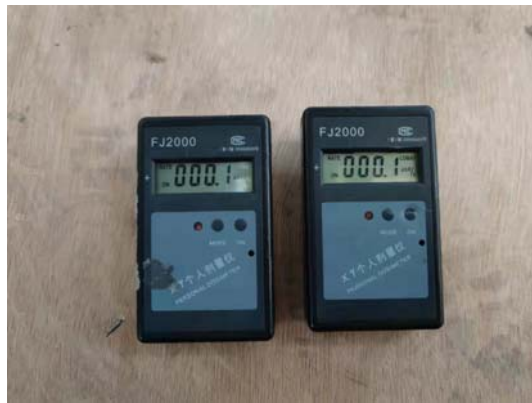
照片 10 个人剂量报警仪