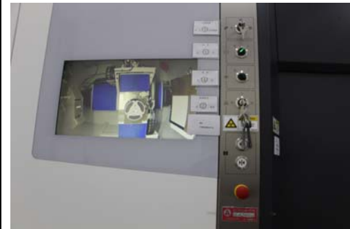
照片 3 工业 CT 钥匙开关、急停开关、监控系统