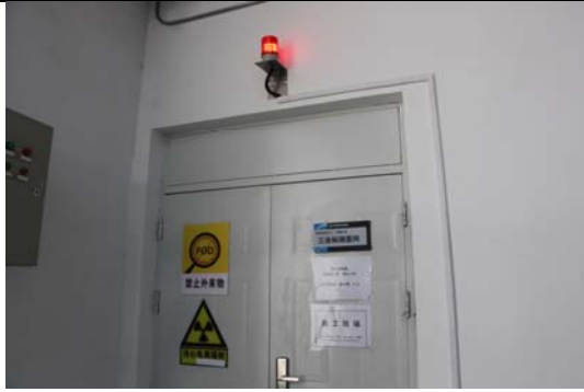
照片 5 当心电离辐射标志及工作状态指示灯