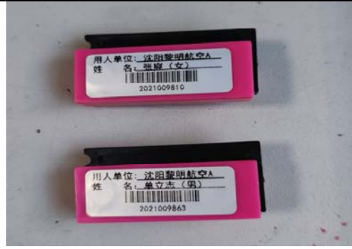
照片 6 个人剂量笔