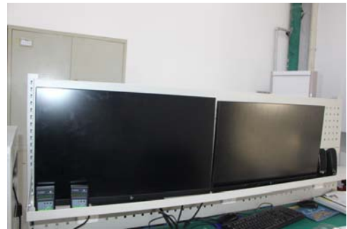
照片 4 操作台