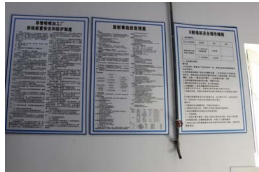
照片 2 辐射防护制度上墙