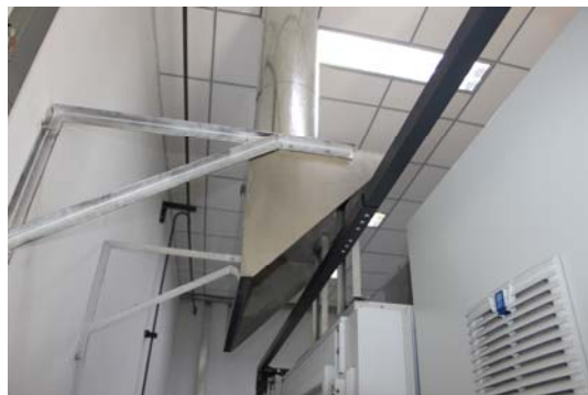
照片 8 排风