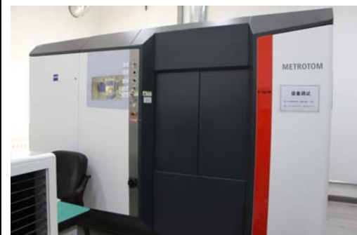
照片 1 工业 CT 检测系统