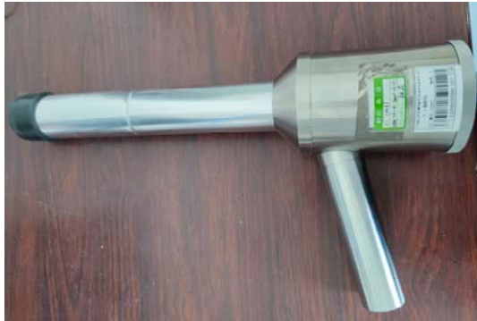
照片 7 辐射监测仪器